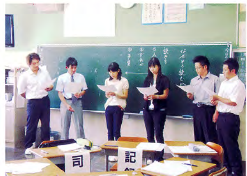
実践を持ち寄っての教育研究集会