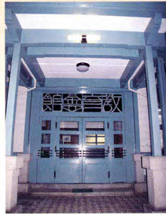
教育会館正面玄関