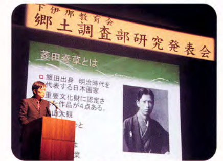
郷土調査部の発表