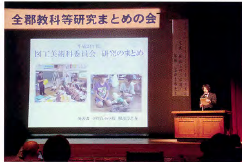
全郡教科等まとめの会