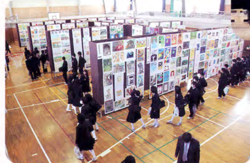
児童生徒の作品多数：郡総合展