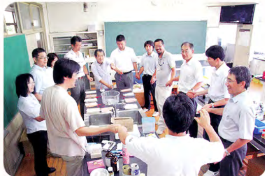
力量を高める実技講習会