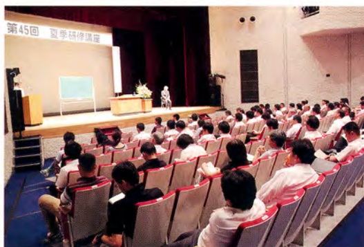
著名な講師を招いての夏季講座