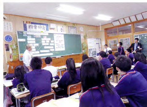
委員自らの研究授業